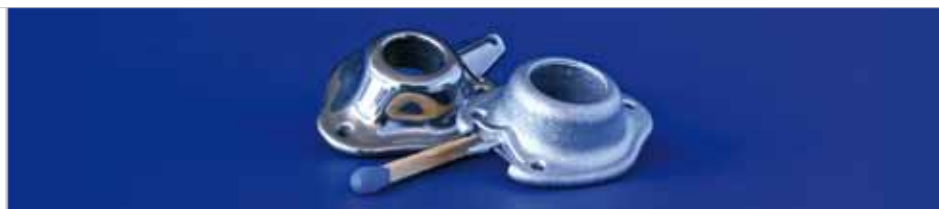
Portsysteem für Katheterzugänge (Medizintechnik) TiAl6V4 Bauteilgewicht 6,33 g