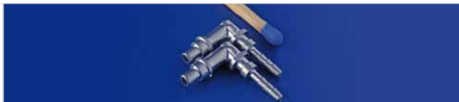
Verbindungsstück für hydraulische Verbindung (Automotive) Edelstahl 316 L Bauteilgewicht 2,25 g